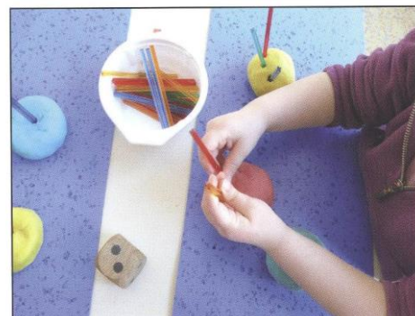
Il décide de placer ses deux bougies sur le même gâteau.

Situation problème : En maternelle, le calendrier scolaire est particulièrement rythmé par les anniversaires des enfants. Préparer le gâteau d'anniversaire, compter les bougies avant de les souffler, comparer le nombre de bougies entre ceux qui ont 3 ou 4 ans..., chanter... ou jouer (exemple extrait de Vers les maths), sont autant d'occasions d'exploitations pédagogiques de situations mathématiques autour de cet évènement important dans la vie de toute la classe.