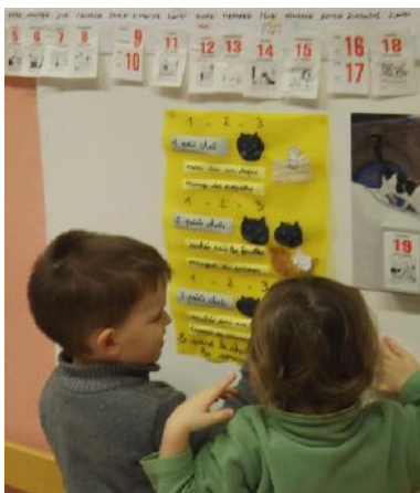
Calendrier et poésie en PS