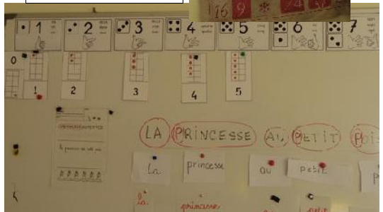
Suite numérique au tableau en GS